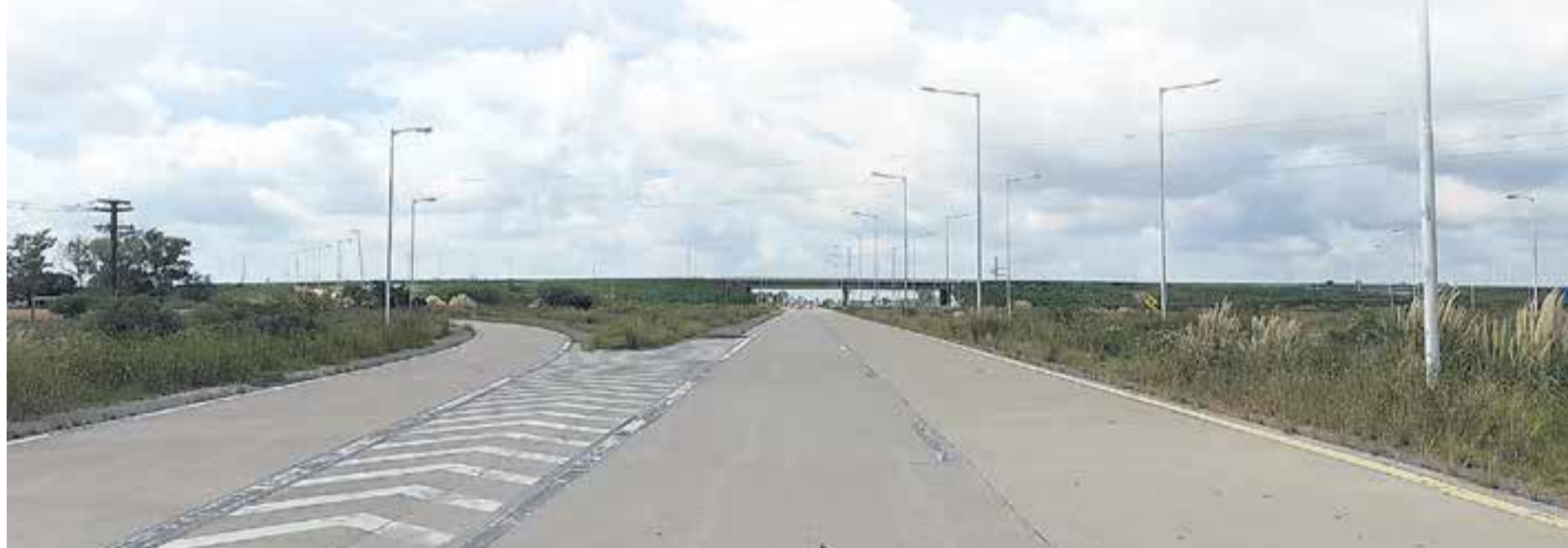
# El acceso sobre ruta 158 para los viajeros que ingresen desde San Francisco. Los conductores deberán girar hacia la derecha para poder ingresar.

Agregó que este tramo es el más problemático porque inicialmente "se licitó una obra donde había una laguna (Bajo Marsón) que no se tuvo en