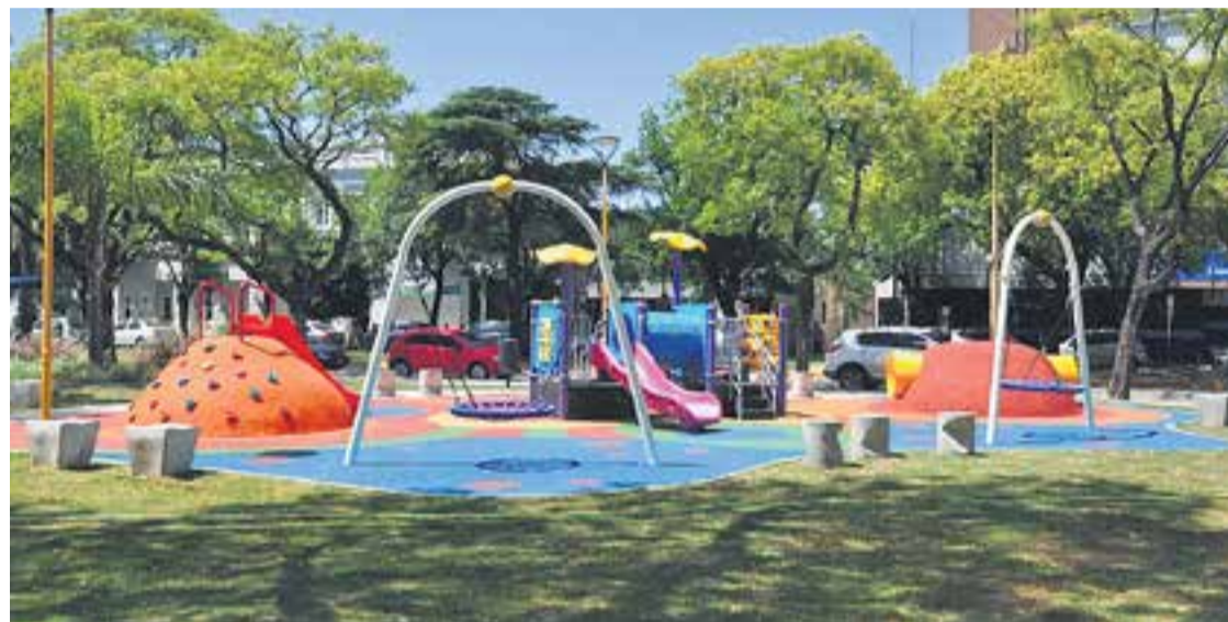
# El remodelado espacio de juegos en Plaza Cívica.

Además de la Plaza Cívica, hubo obras en la Vélez Sarsfield y en el Paseo del Ferrocarril. Siguen la 1° de Mayo y General Paz, a la vez que se hará un relevamiento de todos los espacios verdes para saber qué necesita cada uno.