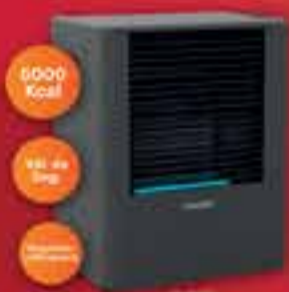
ESTUFA GARRAFERA COPPENS