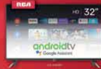
SMART TV LED 32" RCA