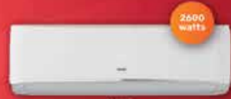
SPLIT FRÍO CALOR RCA