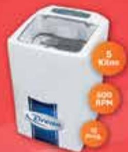
LAVARROPAS AUTOMÁTICO DREAM