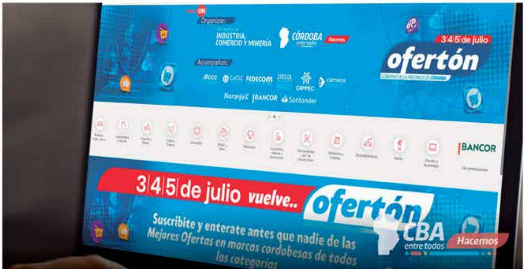
El evento digital, único en Argentina, posiciona a Córdoba en ventas online.