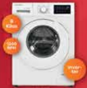
LAVARROPAS AUTOMÁTICO CODINI