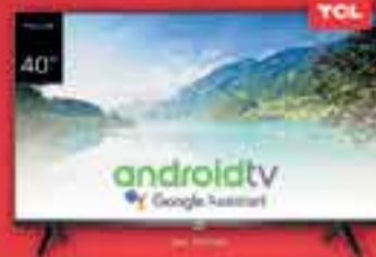
SMART TV LED 40" TCL