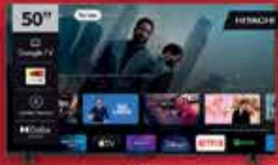
SMART TV LED 50" HITACHI