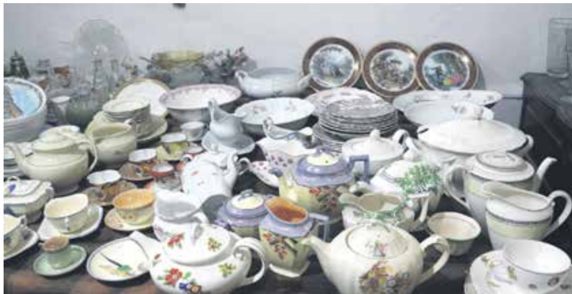
# Una pequeña parte exhibida de su gran colección de vajilla.