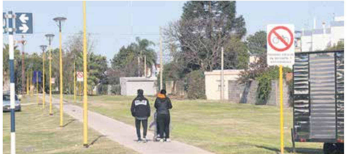
# Una senda ideal para caminatas: sobre el paseo son varias las paradas que se pueden realizar.

Para conocerlo solo basta caminar desde Av. Rosario de Santa Fe y Aristóbulo del Valle hasta Av. Garibaldi y Bv. Roca, o viceversa. Sucede que