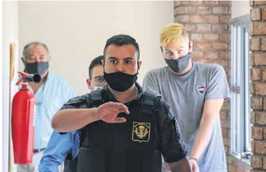
# Sacco se retira de la fiscalía de Delitos Complejos tras presentarse en 2022

Este caso, que tuvo trascendencia nacional y hasta internacional, ya que Sacco estuvo prófugo de la Justicia por unos seis meses y hasta lo buscó la Interpol, tiene otros dos imputados: un hombre y una mujer, ambos por en-