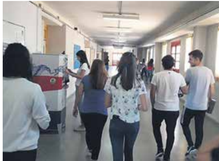
# La universidad es uno de los sueños educativos más grandes de la ciudad.

Aresca aseguró que el proyecto obtuvo también el visto bueno del Consejo Interuniversitario Nacional (CIN). En este sentido, explicó: “El CIN está integrado por las 51 universidades del país y analizó la posibilidad