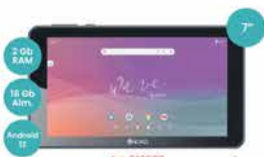
Art. 018537 TABLET EXO

*imágenes ilustrativas y precios sujetos a posibles modificaciones sin previo aviso.