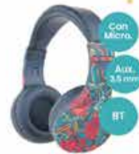
Art. 018441 AURICULAR STROMBERG