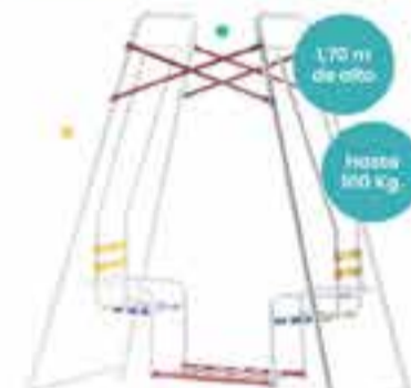
Art. 520149 HAMACA AIMARETTI