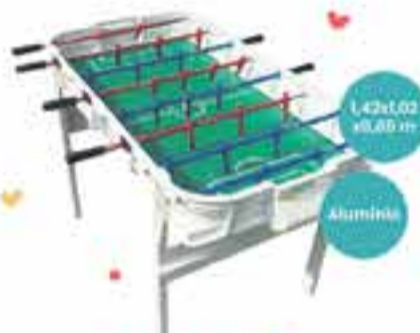
Art. 018126 METEGOL MICROBELL