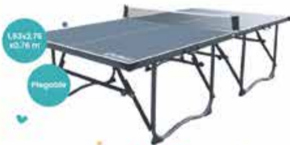
Art. 018125 MESA DE PING PONG MICROBELL