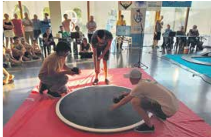
# Las competencias de robótica son todo un atractivo.

Peretti remarcó que además la idea es incentivar el trabajo en equipo, la creatividad y adentrarse en la programación. Lo que se busca también es incentivar a que los jóvenes