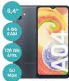
Art. 018121 CELULAR SAMSUNG A04