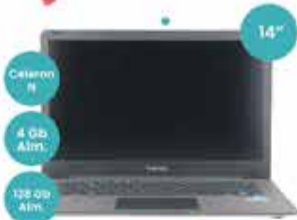
Art. 016102 NOTEBOOK CEVEN VENTURER