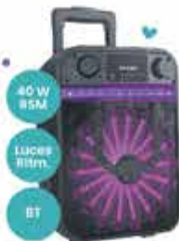
Art. 017617 PARLANTE PHILIPS