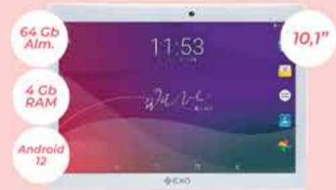
Tablet Exo Art. 018538