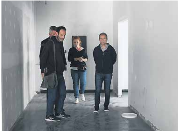
# La próxima etapa incluirá trabajos en iluminación y pintura, entre otros.

Tercera etapa Desde el municipio detallaron que después de la adquisición el equipo de trabajo se abocó en una primera etapa al reemplazo de los vidrios dañados y las aberturas exteriores, luego se incluyó la restauración y pulido de pisos de los tres niveles. En total se renovó una superficie cercana a los 2000 m2, se realizaron demoliciones y