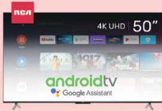
Smart TV LED 50" RCA Art. 018289

*imágenes ilustrativas y precios sujetos a posibles modificaciones sin previo aviso.