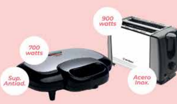
Sandwichera Liliana // Tostadora Westinhouse Art. 018315 // Art. 018757