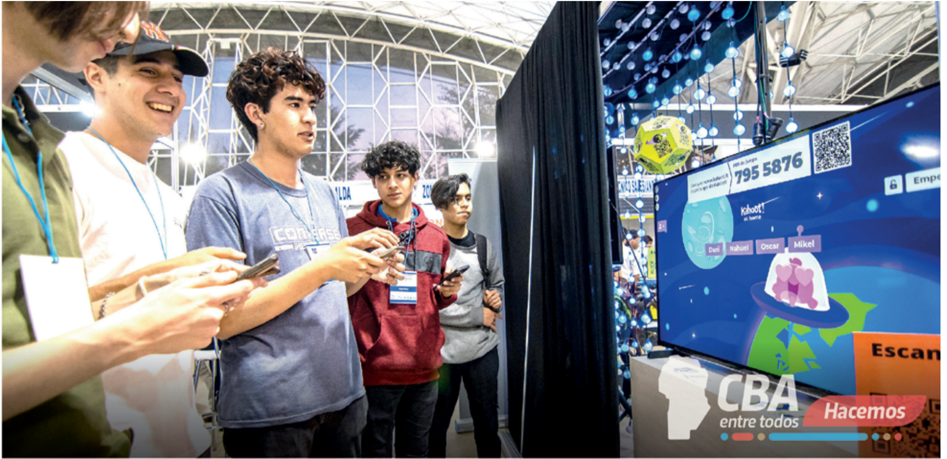
Distintas ciudades cordobesas serán sede de la Semana TIC.