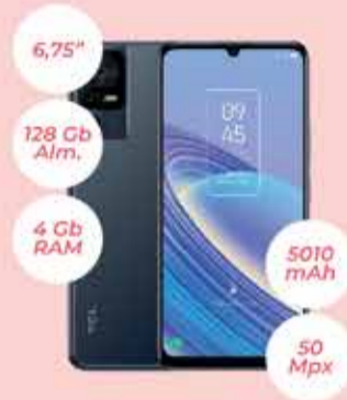
Celular TCL 40se Art. 018724