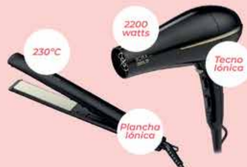
Planchita Gama Bella // Secador Gama Bora Art. 018769 // Art. 018764