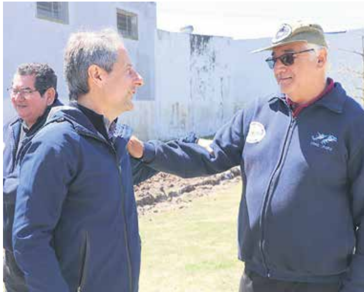
# Bernarte y ex soldados estuvieron en el inicio de las obras.

Giletta expresó su alegría de poder contar, finalmente, con un espacio propio después de 42 años. "Vamos a tener un lugar donde reunirnos, donde juntar-