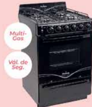
Cocina Florenzia Art. 015016