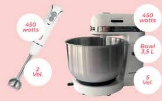
Mixer Liliana Rainbow // Batidora Ken-Brown Art. 014627 // Art. 016527