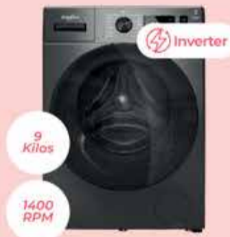
Lavarrapas Whirlpool Art. 018777