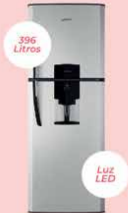
Heladera Drean Art. 018781