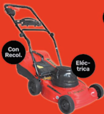
Cortadora de Césped Petri Art. 540146