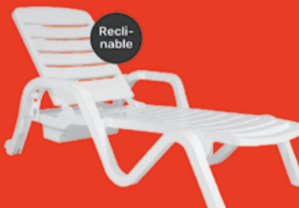
Reposera Garden Life Art. 660006