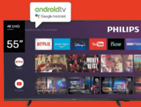
Smart TV LED Art. 017445