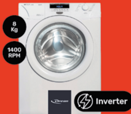
Lavarrupas Drean Art. 013435