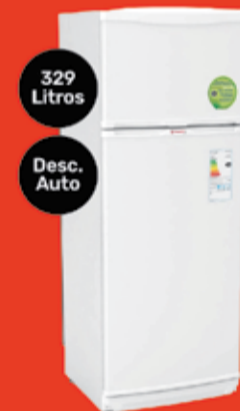
Heladera Bambi Art. 017065