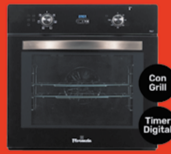
Horno Eléctrico Florenzia Art. 017772