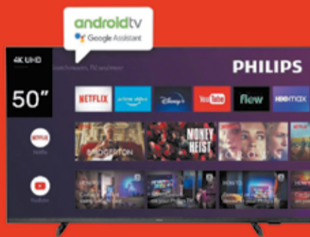
Smart TV LED Art. 017774