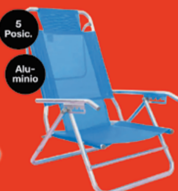
Reposera Avelino Art. 018785