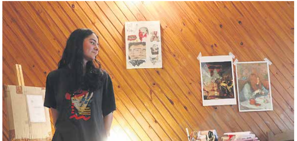
# Más de 200 mil seguidores en Tik Tok la animan a incursionar en el arte gore.

- Aprovecho la técnica de los autorretratos porque saco la foto, yo me armo la escena y