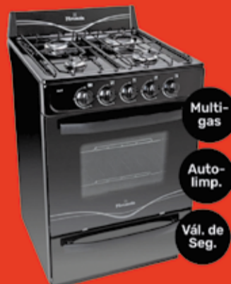
Cocina Florenzia Art. 340592