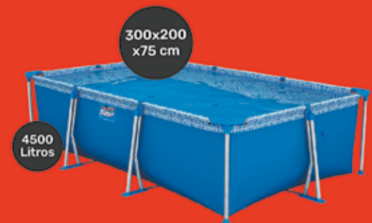
Pileta de Lona Pelopincho Art. 550028