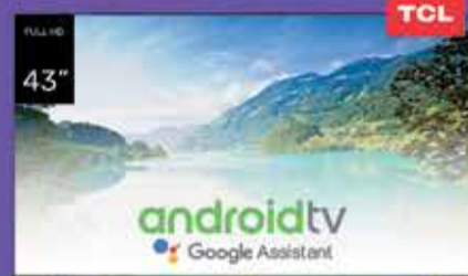
Smart TV LED 43" TCL Art. 018753