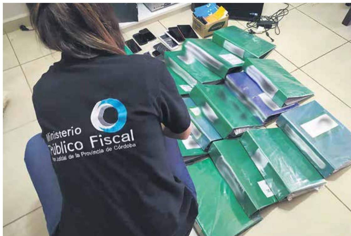
# Hubo varios allanamientos del MPF desde que se investiga la presunta estafa.