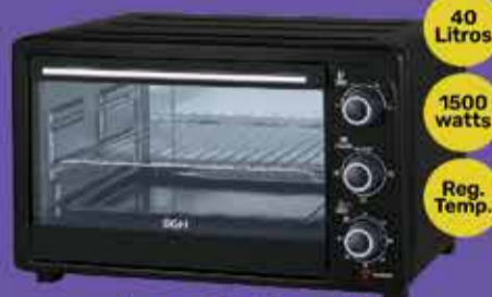
Horno Eléctrico BCH Art. 018796