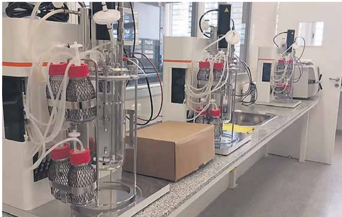
# La escuela cuenta con dos laboratorio altamente equipados.

Limpia la escuela con productos elaborados por sus estudiantes en el laboratorio es más que un proyecto educativo. Es también una satisfacción de parte de la comunidad educativa de la escuela Proa con