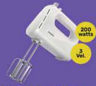
Batidora Manual Philips Art. 015835