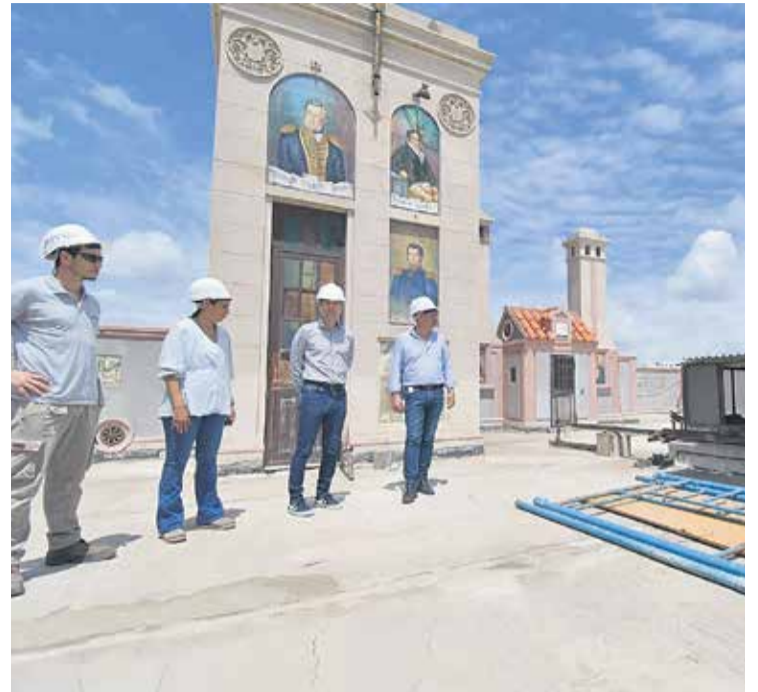
# Además de museo, la idea es que el palacio reciba distintos eventos culturales.