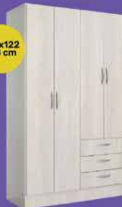
Placard Platinum Art. 016767