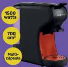
Cafetera Kanji Art. 015076