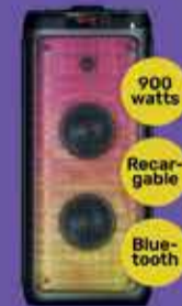
Parlante Moonki Sound Art. 017843