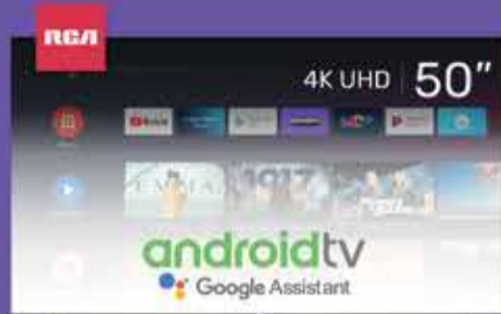
Smart TV LED 50" RCA Art. 018773

*imágenes ilustrativas y precios sujetos a posibles modificaciones sin previo aviso.