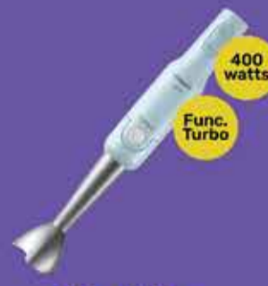
Mixer Philips Art. 017863