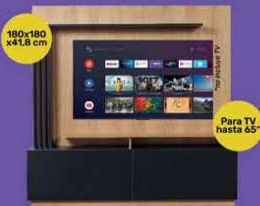
Centro Entretenimiento Ricchezza Art. 018746