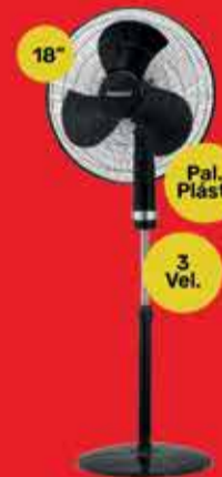
Ventilador de Pie Peabody Art. 017698