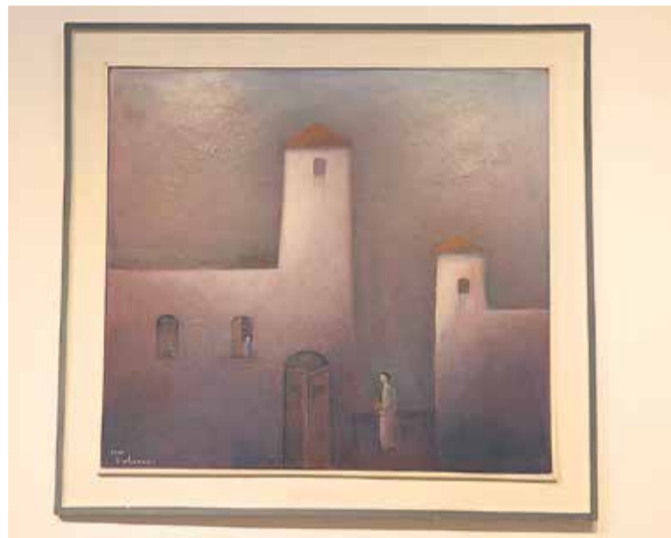
# El pintor falleció en 2015, dejando obras de importante calidad artística.