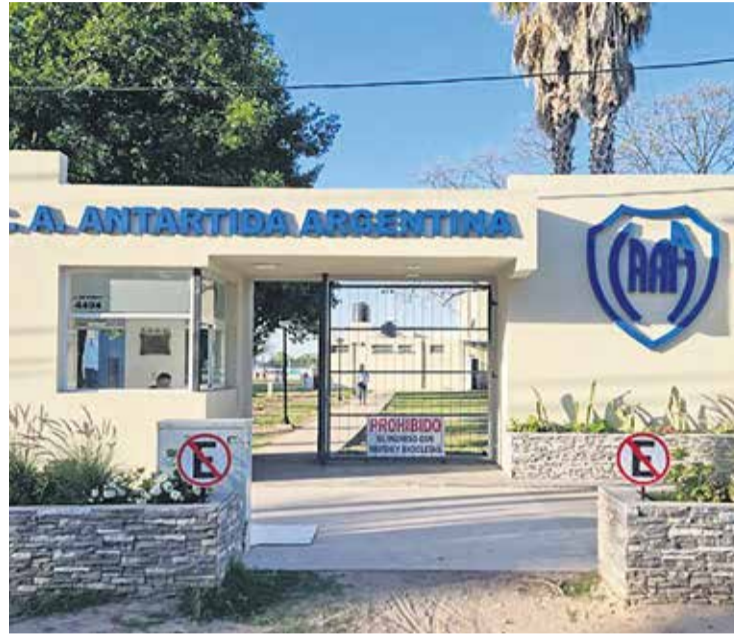
# Antártida Argentina tuvo gran crecimiento en los últimos años.

sus colores al azul con ribetes blancos y se asentó en barrio Roca, en calle Lamadrid al 2500 donde funciona su sede social.