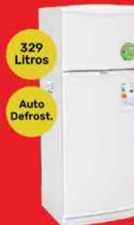
Heladera Bambi Art. 017065