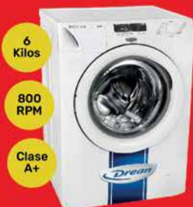
Lavarropas Dreon Art. 013747