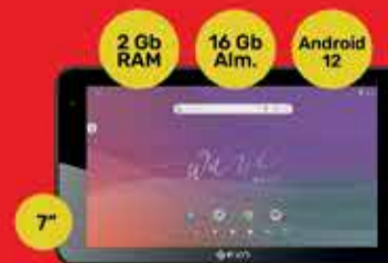
Tablet Exo Wave Art. 018537