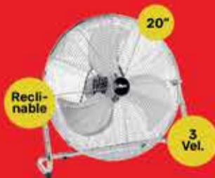
Turbo Ventilador Liliana Art. 013451