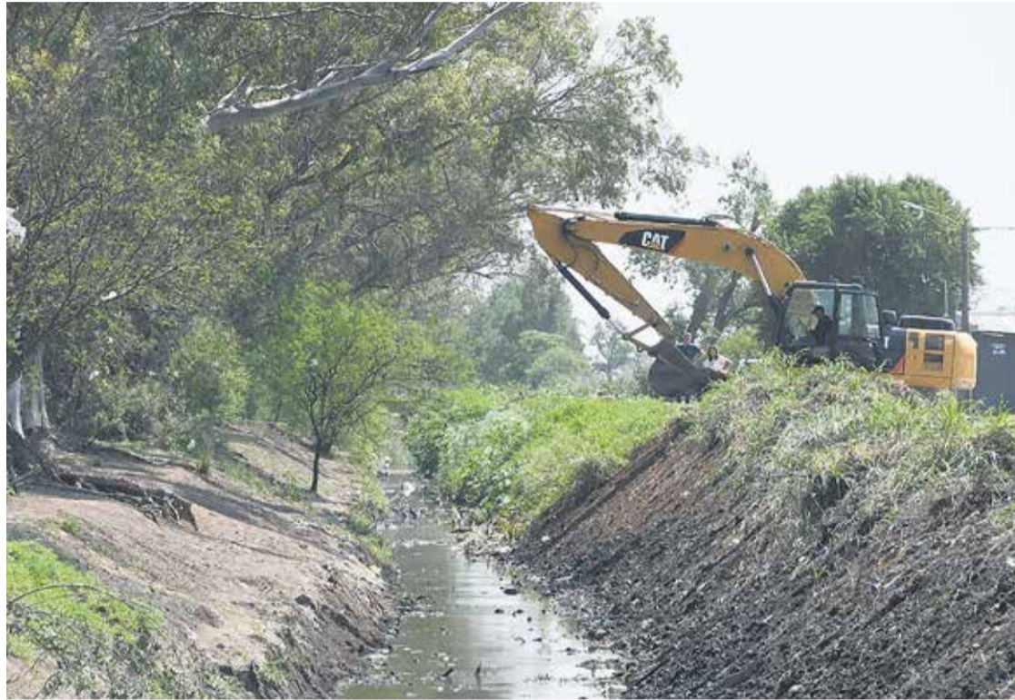
# Cada semana, la Municipalidad realiza tareas de limpieza en los canales de desagües pluviales.

Así lo confirmó el secretario de Infraestructura a El Periódico. Se construirá una planta nueva adyacente a la existente para la fabricación exclusiva de puentes de hormigón. Para aprovechar la obra podrían crearse nuevas bicisendas o sendas peatonales.