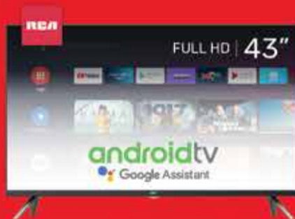
Smart TV LED 43" RCA Art. 018772