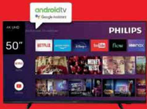
Smart TV LED 50" PHILIPS Art. 017774

*imágenes ilustrativas y precios sujetos a posibles modificaciones sin previo aviso.