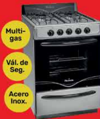
Cocina Florencia Art. 011565