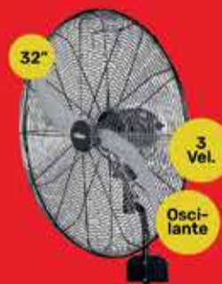
Ventilador de Pared Liliana Art. 013452