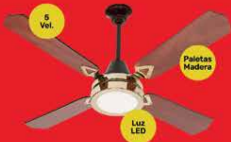
Ventilador de Techo Severbon Art. 017738