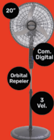
Ventilador de Pie Liliana Art. 015574