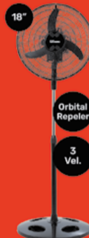
Ventilador de Pie Liliana Art. 070159