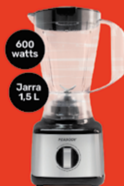
Licuada Peabody Art. 018151