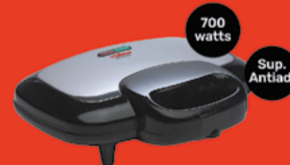
Sandwichera Liliana Art. 018315