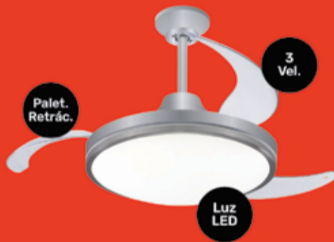
Ventilador de Techo Peabody Art. 018677