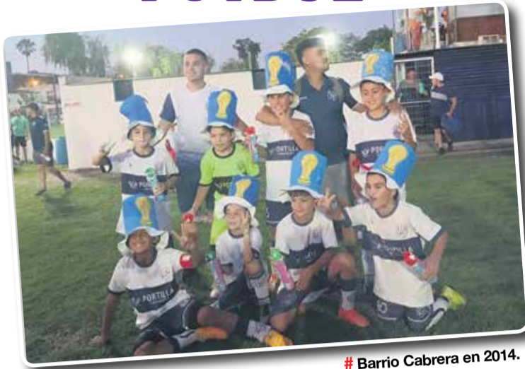
# Barrio Cabrera en 2014.