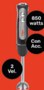
Mixer Liliana Art. 017029