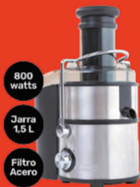
Extractor de Jugo Peabody Art. 010719