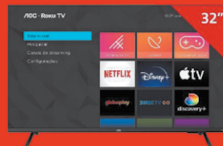
Smart TV LED AOC Art. 018807