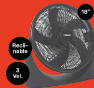
Turbo Ventilador Liliana Art. 015848