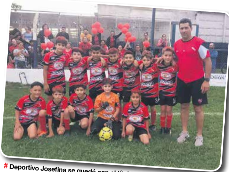
# Deportivo Josefina se quedó con el título en 2013.

En la categoría 2011 el puntero es Estrella del Sur con 27 unidades, lo secunda Belgrano con 26 y de aquí saldrá el campeón. En la división 2012 el puntero es Belgrano con 33 puntos y lo escolta el último campeón, Deportivo Norte, con 31. EP