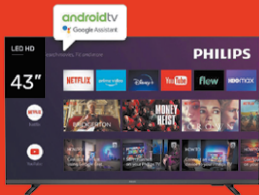
Smart TV LED Philips Art. 017700