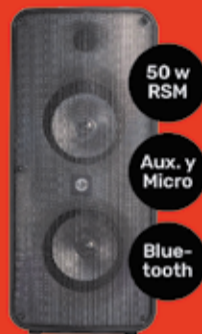
Parlante Stromberg Art. 018439