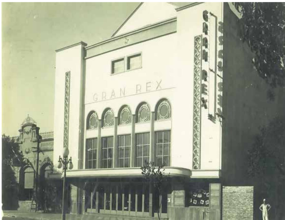
# El Cine Gran Rex en su esplendor.

El Archivo Gráfico y Museo realizó un nuevo Paseo Cultural por el lado Norte de la avenida y hubo una buena convocatoria. Acá rescatamos una historia que tiene mucha nostalgia.