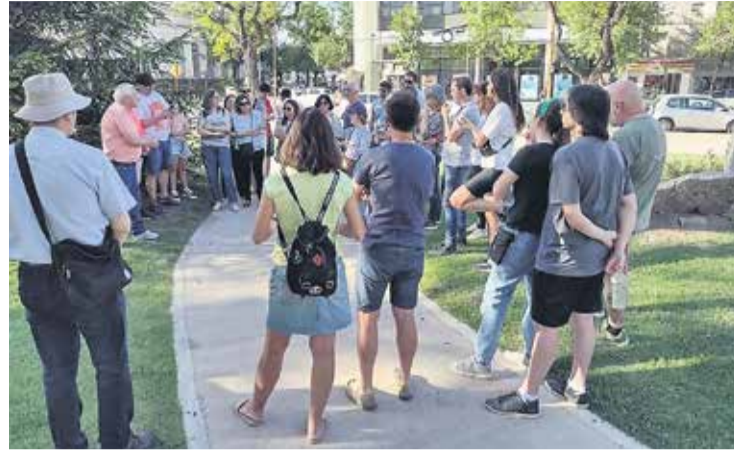
# Sobre la esquina Noreste en intersección de Bv. 25 de mayo y Av. Libertador Norte estuvo el Cine Ferrazi entre 1920 y 1925.

El cine "Ferrazzi" funcionó hasta 1925. Pasó mucho tiempo hasta que a pocos metros de allí se inauguró el Teatro y Cine