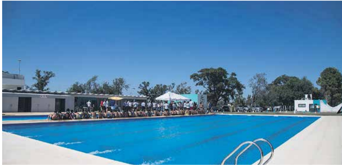
# El cupo de becas es para 40 deportistas de San Francisco divididos en dos niveles.

Los deportistas interesados podrán obtener la planilla de