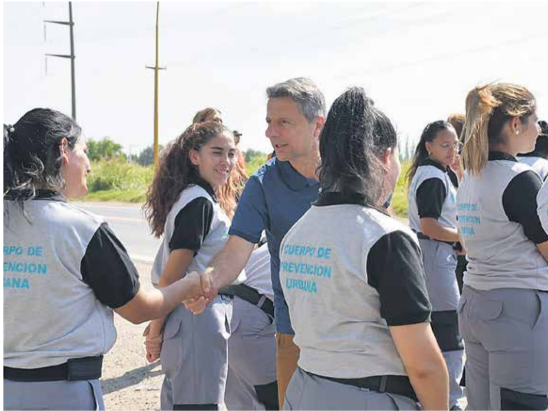
# Bernarte anunció la salida a la calle del flamante Cuerpo de Prevención.

La Municipalidad de San Francisco informó que los integrantes del flamante Cuerpo de Prevención Urbana (CPU) se encuentran listos para entrar en funciones y que sus primeras tareas serán en la Peatonal y el Festival de la Buena Mesa . Esta semana, los 42 integrantes de la fuerza realizaron una nueva capacitación, a cargo de la Policía Caminera.