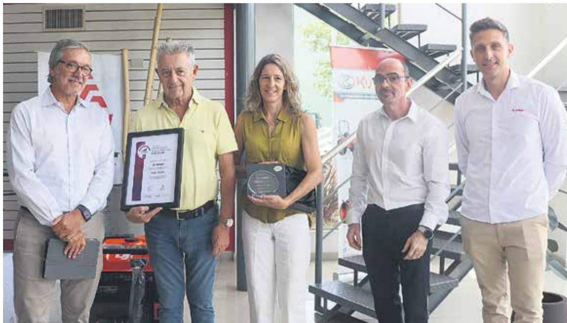
# Akron fue reconocido por la Fundación Premio Nacional a la Calidad.

"Estamos honrados de recibir este certificado que refleja