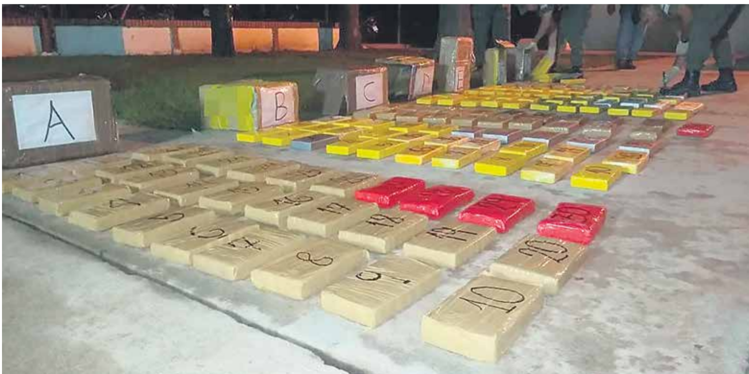
# La droga se hallaba en "ladrillos" que se encontraban dentro de cajas, algunas con nombres y apodos.

Los casi 157 kilos de cocaína iban escondidos debajo de maderas que eran transportadas por un camión que viajaba desde Salta hacia Buenos Aires. De los dos detenidos, solo uno reconoció que fue contratado para el trabajo.