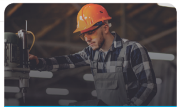
Usuarios hasta 300kW

El financiamiento se aplica sobre la diferencia entre la tarifa de febrero 2024 respecto de enero 2024.