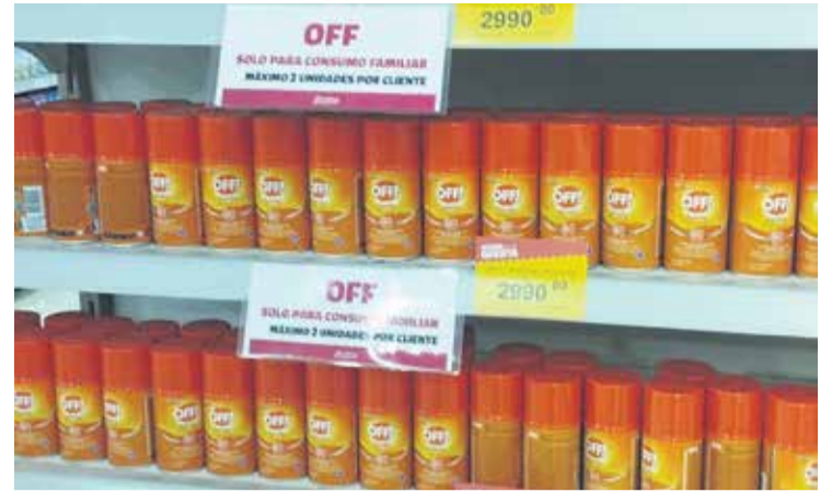
# Las marcas más conocidas se venden en cuestión de minutos.

También indican no aplicar debajo de la ropa, ni en cortaduras, heridas o piel irritada. No rociar productos con DEET directamente a la cara; aplicarlo en las manos y después frotarlas cuidadosamente sobre la cara, evitando los ojos y la boca. Tampoco aplicarlas en áreas cerradas.