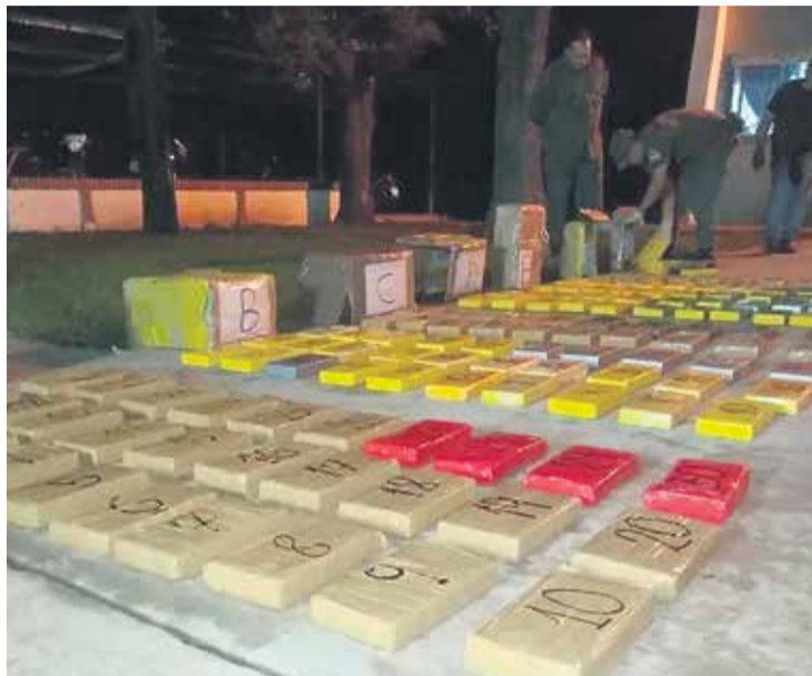
# Droga secuestrada en un operativo.

Otra de las investigaciones en marcha es la relacionada al secuestro de 156,9 kilogramos de cocaína sobre ruta provincial 1, a la altura de Morteros. La droga viajaba desde Orán, provincia de Salta, hasta provincia de Buenos Aires, en un camión Scania que fue controlado por Gendarmería Nacional.