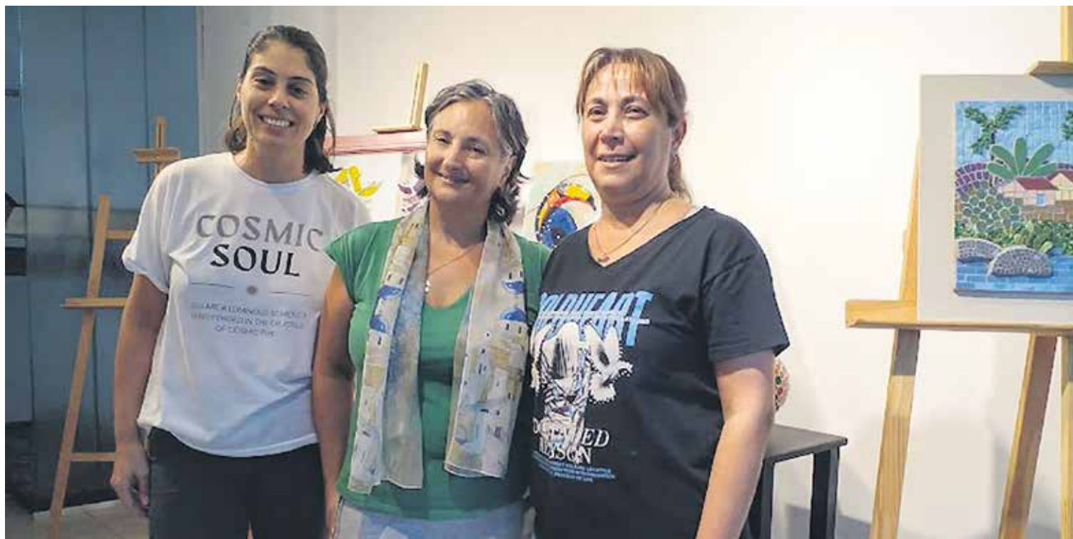
# La exposición reúne obra de las tres mujeres y estará abierta todo abril.