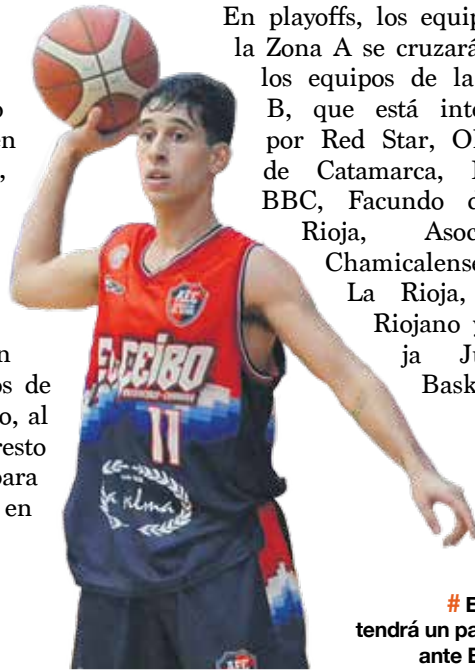
# El Ceibo tendrá un partidazo ante Bochas.

En playoffs, los equipos de la Zona A se cruzarán con los equipos de la Zona B, que está integrada por Red Star, Olimpia de Catamarca, Hindú BBC, Facundo de La Rioja, Asociación Chamentalense de La Rioja, Club Riojano y Rioja Juniors Basket. EP