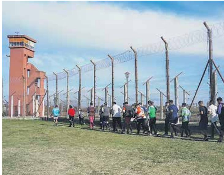
# Los Caranchos compitieron en Córdoba y se consagraron campeones.