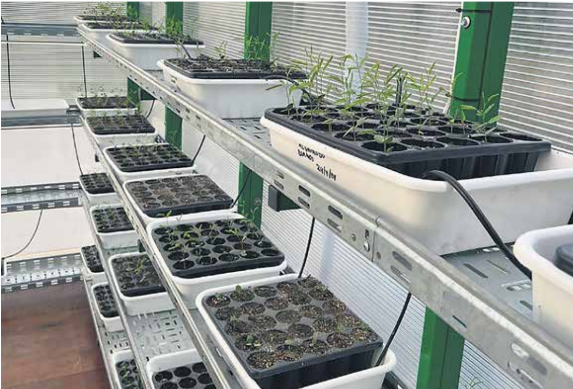
# El espacio municipal podría producir hasta 7000 plantines por mes.

ración oficial, Mulassano señaló que el objetivo, una vez finalizado dicho proceso formal, será comenzar a trabajar con escuelas e instituciones locales. "La idea es capacitar a la comunidad en la producción y cuidado de las especies, para fomentar un arbolado urbano sostenible", añadió.